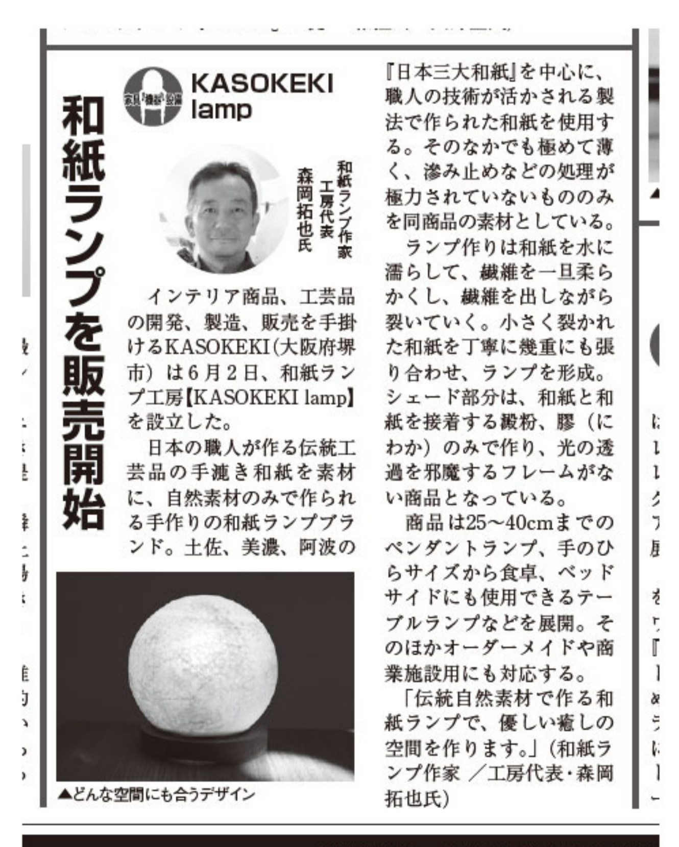
ブライダル産業新聞社