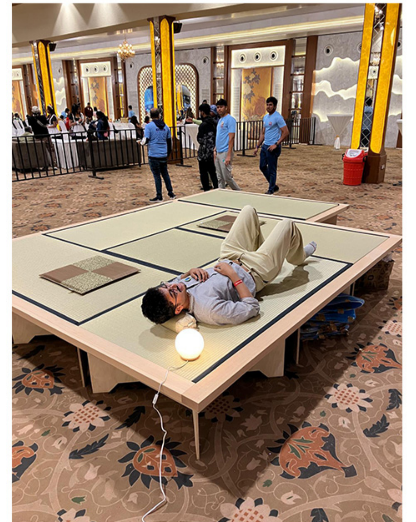
インド アニメフェス