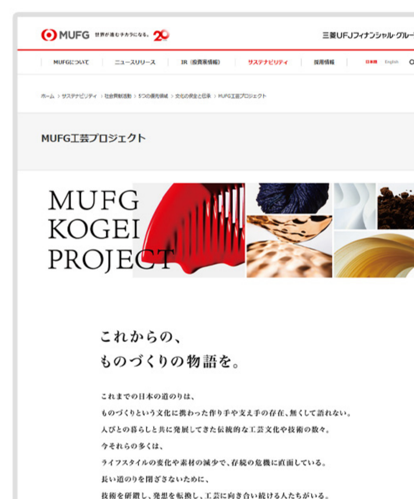
MUFG UFJ工芸プロジェクト