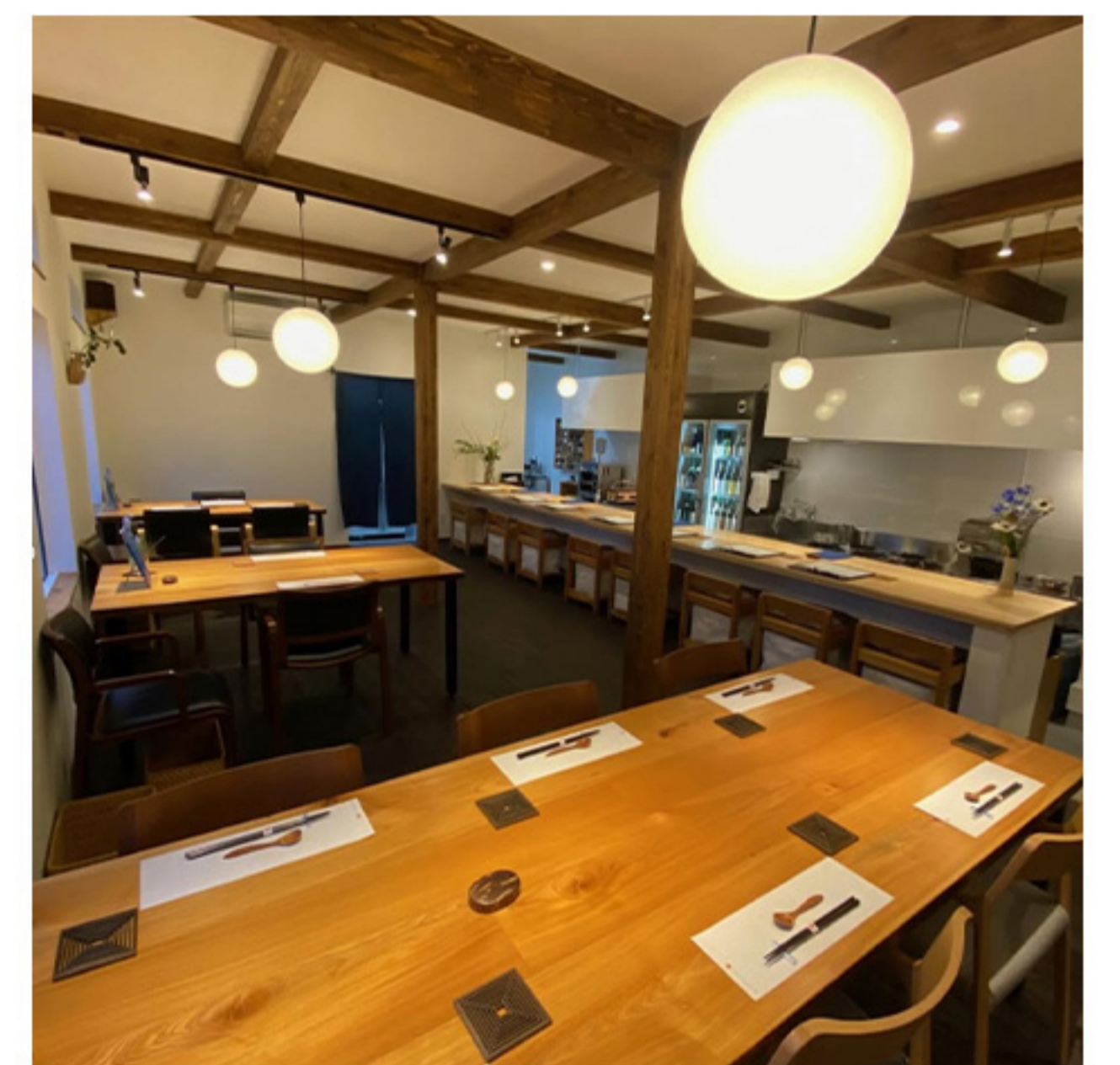
和食と酒 はれとけ